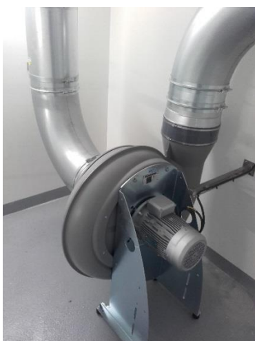
Extraction de buées