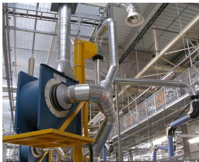
Extraction de fumées de soudure