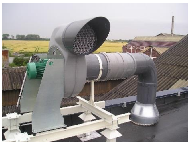
Extraction de gaz corrosifs