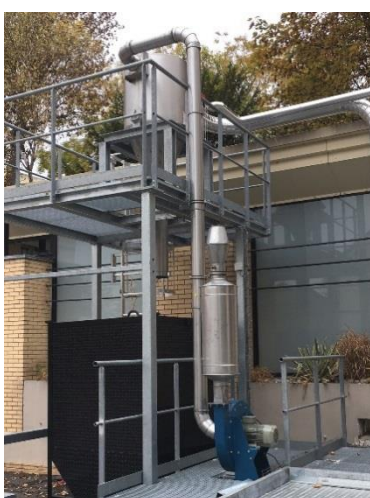
Transfert de capsules de bouchon de champagne (plaques de muselet)